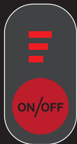
ハイパワー (急速) 2 時間持続*