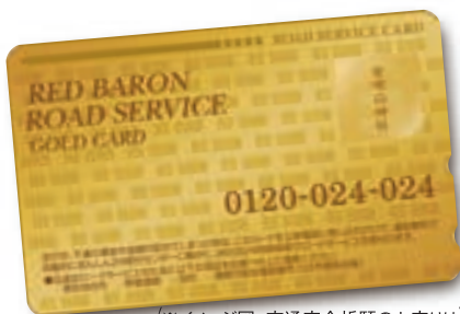
(※イメージ図。交通安全祈願のお守りはカードケースに付与されています。)